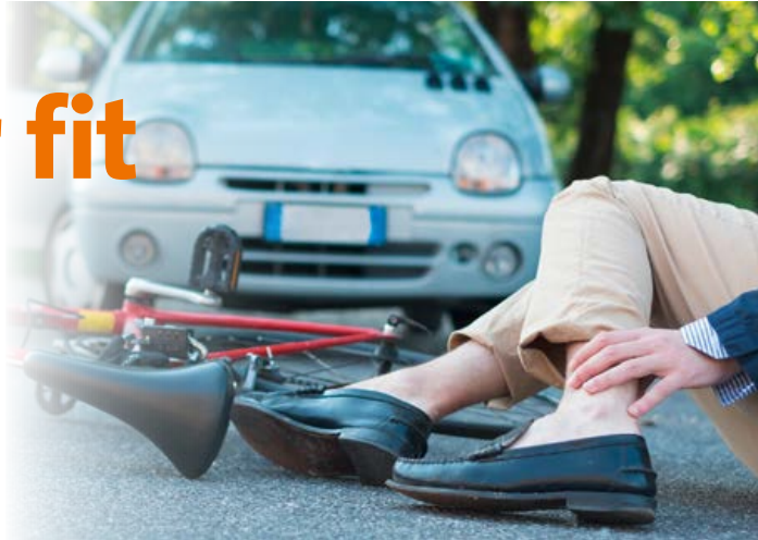
Verletzungen an Knöchel und Knie treten bei Unfällen besonders häufig auf.

Ein Sturz beim Radfahren, ein verdrehter Knöchel – Unfälle kommen unverhofft. Am häufigsten sind Verletzungen des Sprunggelenks und der Knie. Die meist folgende Ruhigstellung, Therapie sowie Reha-Maßnahmen belasten nicht nur Sportler, die möglichst schnell wieder trainieren wollen. Die Akupunktur kann hier viel leisten: Sie reduziert Schmerzen und beschleunigt die Regeneration.